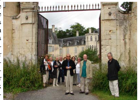
Le groupe devant le portail du manoir de La Pellonnière à Le Pin-La Garenne